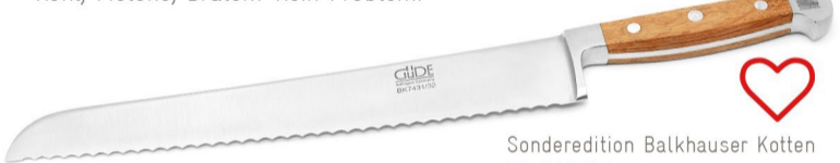
Sonderedition Balkhauser Kotten ID: 113725

Güde Brotmesser spielen in einer eigenen Liga. Einmal damit gearbeitet, will man kein anderes mehr. Harte Krusten, Kohl, Melone, Braten? Kein Problem!