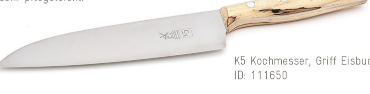
K5 Kochmesser, Griff Eibuche ID: 111650

Die K-Serie kombiniert europäisches und japanisches Design mit extrem hochwertigem Messerstahl. Die rostfreien Messer haben eine Härte von ca. 60 HRC und sind dabei sehr pflegeleicht.