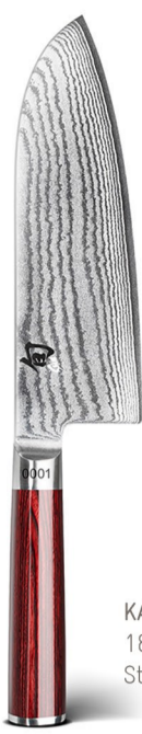
KAI SHUN Red Edition Santoku 18cm Klinge, limitiert auf 3000 Stück ID: 117651.

Ein ganz besonderes Highlight ist das KAI SHUN RED EDITION SANTOKU , ein Kochmesser mit extra hoher Klinge. Auf 3000 Stück limitiert.