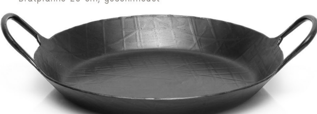
Bratpfanne 28 cm, geschmiedet

Kai bietet auch in diesem Jahr wieder tolle Sondereditionen zu günstigen Preisen. Diese und viele weitere Angebote finden Sie unter Angebote -> Kai Sondereditionen