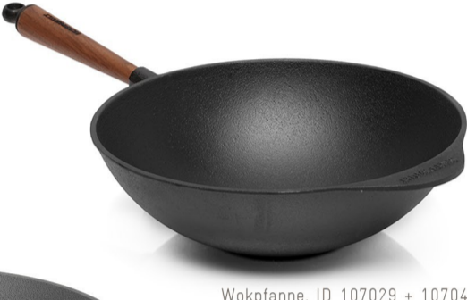
Wokpfanne, ID 107029 + 107049

Wir sind begeistert! Und Sie werden es auch sein. Freuen Sie sich auf exzellente Brat- und Kocheigenschaften, die Sie mit den Skeppshult Pfannen und Brätern erzielen.