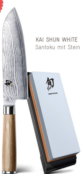
KAI SHUN WHITE Santoku mit Stein