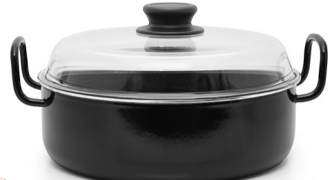
Omars Schmorpfanne, 24/28 cm ID: 116934 & 116935