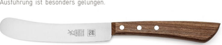
150 Jahre Edition: ID: 116705

Das Buckels ist der meistverkaufte Klassiker im Sortiment der Solinger Manufaktur. Die limitierte 150-Jahre Jubiläums-Ausführung ist besonders gelungen.