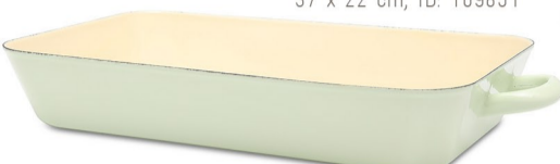
Bratpfanne 37 x 22 cm, ID: 109851

Das österreichische Traditionsunternehmen fertigt in Handwerk die hochwertigen Emaille-beschichteten Töpfe und Pfannen. Riesen Auswahl!