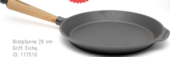
Bratpfanne 26 cm Griff: Eiche, ID: 117510

Jetzt mit tollen Kombi-Angeboten mit G&U Kochbüchern. -> Unter ANGEBOTE.