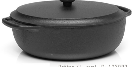
Bräter 4L, oval ID: 107083