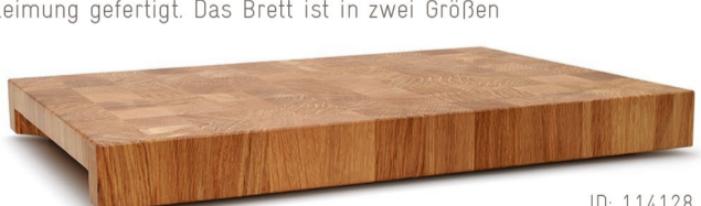
ID: 114128 & 114633

Unser hauseigenes Schneidbrett wird sehr hochwertig in Stirnholz-Verleimung gefertigt. Das Brett ist in zwei Größen erhältlich.