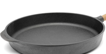
Servierpfanne 28 cm Griff: Eiche, ID: 117511