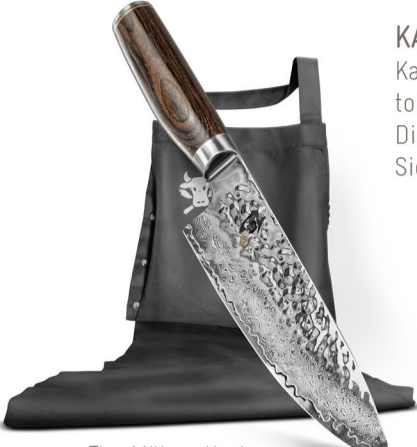
Tim Mälzer Kochmesser inkl. Schürze