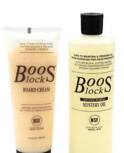
ID: 103483 & 103484

Die in den USA aus einheimischem Ahorn-Stirnholz gefertigten Schneidbretter sind extrem robust und schön im Design. Mit dem Boos Blocks Pflege-Set sind Ihre Holzprodukte bestens geschützt.