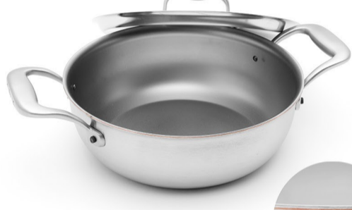
Gulaschtopf 28 cm / 24 cm