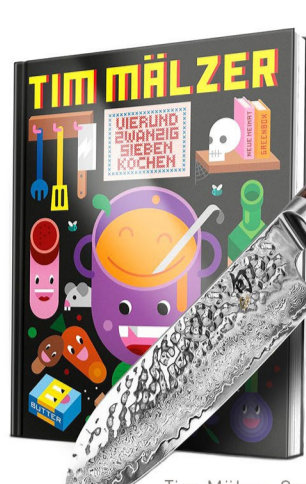
Tim Mälzer Santoku inkl. Kochbuch